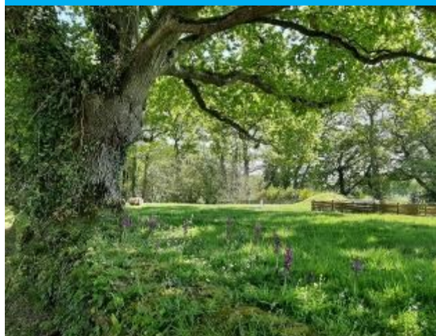
Chêne centenaire et orchis mâle