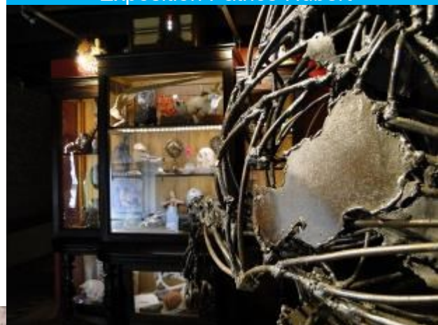
Exposition Cabinet de curiosités