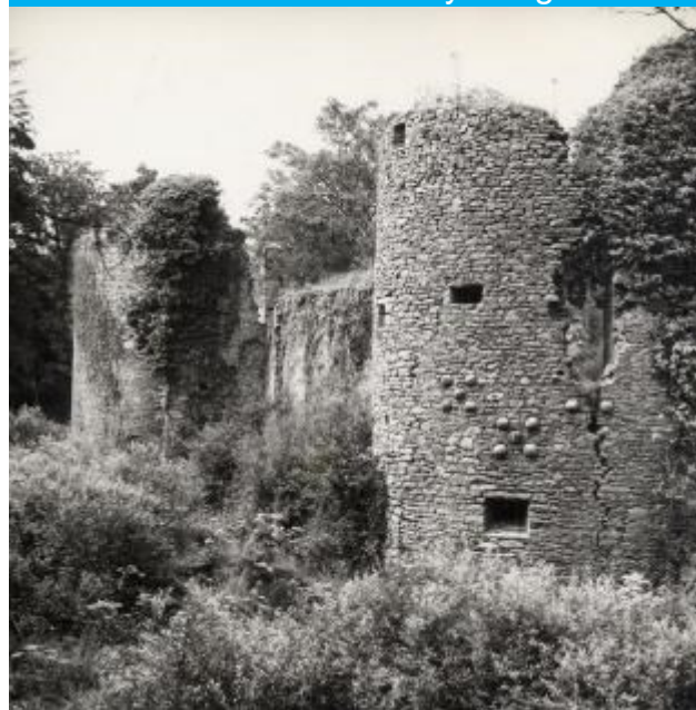
Château avant la restauration