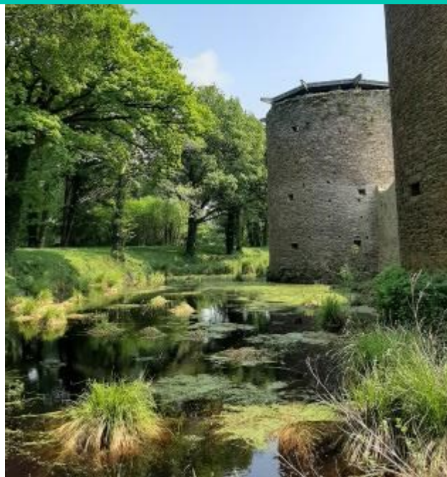
Les douves du château, une belle biodiversité