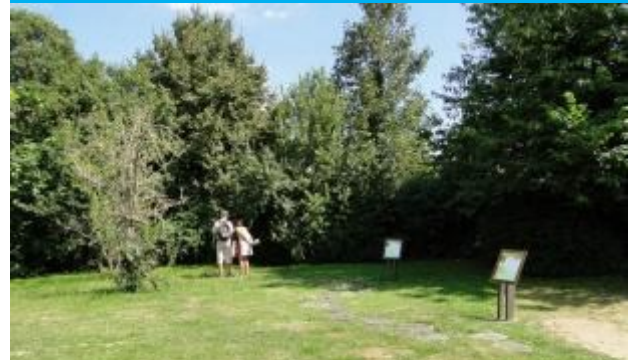
Aire de pique-nique

Attention, située dans les marais, cette randonnée n'est pas accessible toute l'année (mai-octobre).