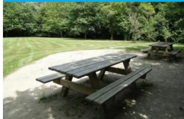
Aire de pique-nique

Attention, il n'y a pas de zone abritée en cas de pluie.