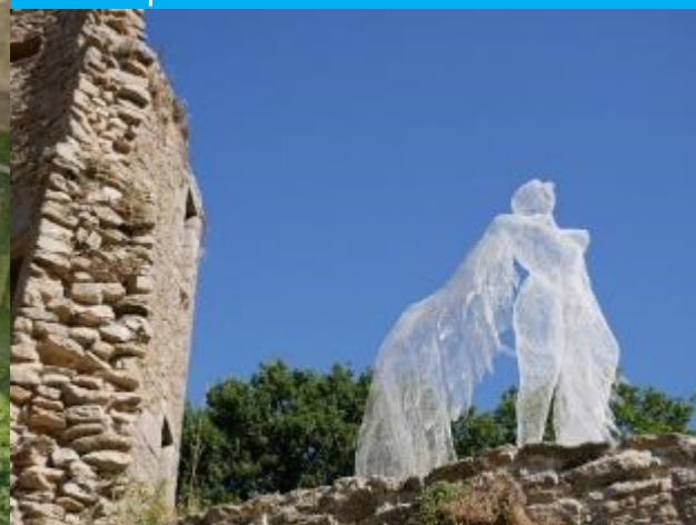
Exposition de sculptures de Daniela Capaccioli