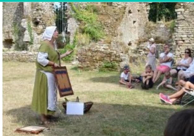
Vie quotidienne au Moyen Age