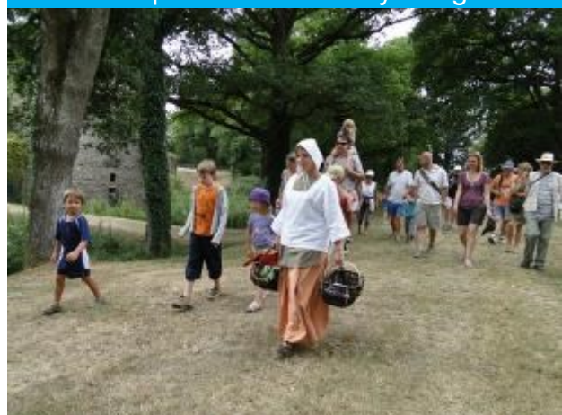
Alimentation au Moyen Age